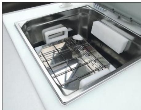
SONODYN 17-E Contenance : 1 panier P12 ou 2 paniers P3