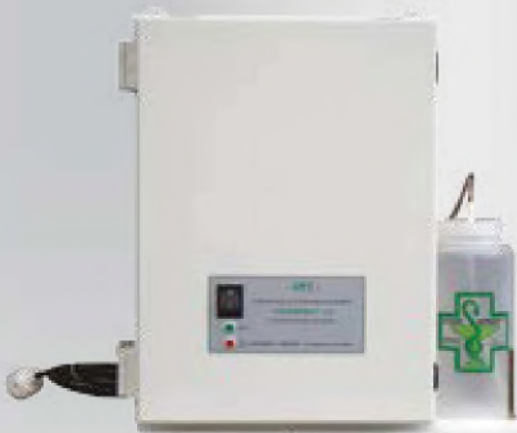
Dosage automatique du produit STERISPRAY® L2