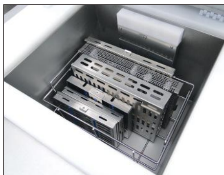
SONODYN 17-EK7 Contenance : 1 panier porte-cassette PC17 ou 1 panier P12 ou 2 paniers P3