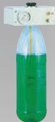
Dosage manuel du produit STERISPRAY® L2

La Centrale SP2 permet d'alimenter jusqu'à 40 fauteuils dentaires.