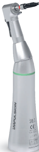
Contre-angle d'implantologie Tête guillotine