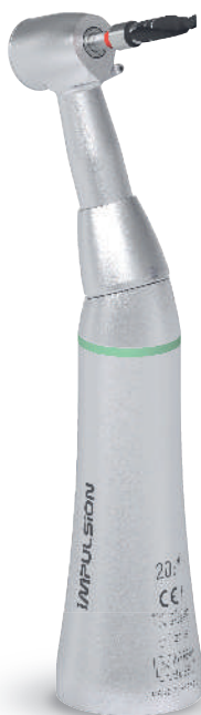
Contre-angle d'implantologie Tête bouton poussoir