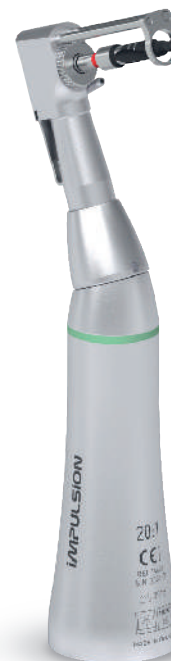
Contre-angle d'implantologie Tête guillotine et butée