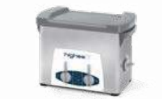
Highea 3 LAVAGE