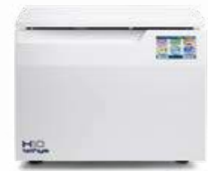
Tethys H10 plus THERMO-DÉSINFECTION