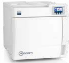
B Classic AUTOCLAVES