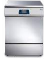
Tethys T60 - Tethys D60