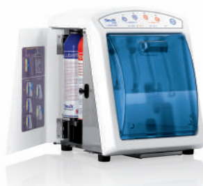
LUBRICARE Système de maintenance REF. 1600915-001