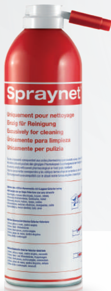
SPRAYNET 500 ml spray de nettoyage. Emballage de 6 pièces REF. 1600036-006