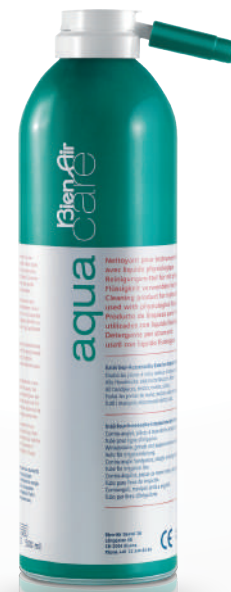
AQUACARE 500 ml spray de nettoyage. Emballage de 6 pièces REF. 1600617-006