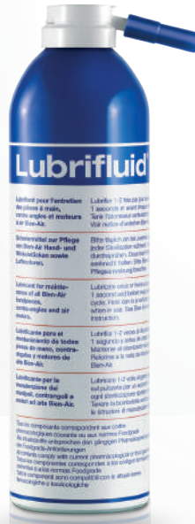
LUBRIFLUID 500 ml lubrifiant Emballage de 6 pièces REF. 1600064-006