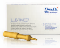
LUBRIMED Emballage de 6 cartouches REF. 1600037-006